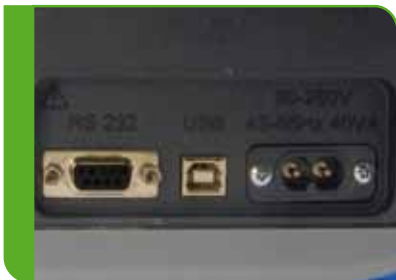
Kommunikation über USB- und RS232-Schnittstelle.