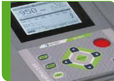
Unkomplizierte und schnelle Abstimmung der Pröfeinstellungen.