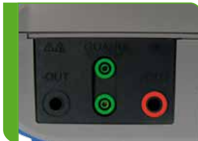
Das Anschlussfeld zum anschliessen der geschirmten Prüfleitungen.