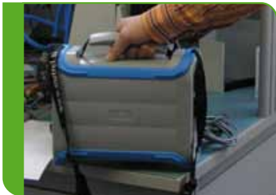
Griff und Schulterriemen erleichtern das Tragen des Geräts.