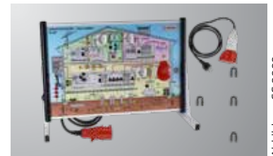
Abbildung CS 2099