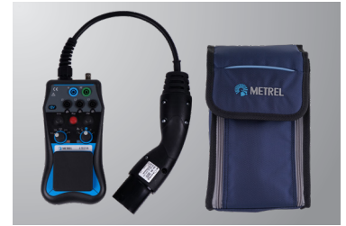
Abbildung A 1532 XA